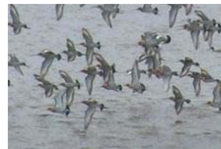
Eindeloos veel grutto's in de polder bij Eemnessersluis

De maand van Hemus wordt maandelijks per e-mail aan alle leden van Roeivereniging Hemus gezonden. Redactie: Ilja van Buitenen, Koos Termorshuizen, Jos Wassink. Adreswijzigingen doorgeven aan de ledenadministratie. Onopgemaakte kopij en tips naar redactie@hemus.nl